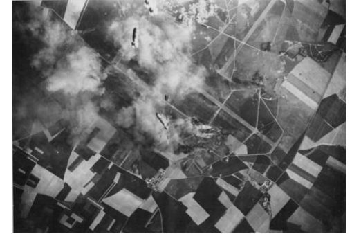
Bombardements pendant la deuxième guerre mondiale

Le 28 février 1948, le colonel Constantin Rozanoff ouvrira la voie de l'aérodrome aux avions à réaction en décollant pour son premier vol d'essai, un Dassault Ouragan équipé de moteurs Rolls-Royce Nene. Il trouvera malheureusement la mort le 3 avril 1954 lors de la présentation d'un Mystère IV à la suite d'une défaillance des commandes de vol.